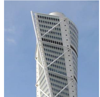
Turning Tower - Malmö (Suède) 2005